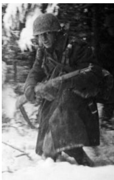
Soldat US dans la neige ardennaise