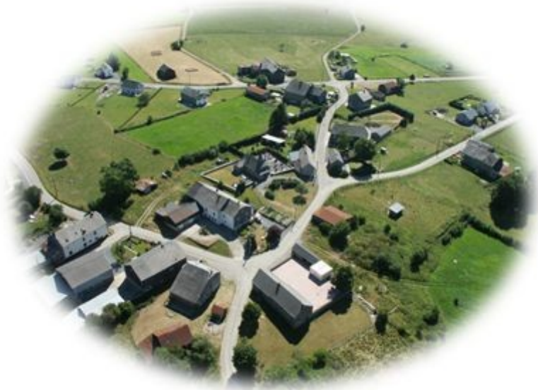
Vue aérienne d'Arloncourt

à gauche, continua à tirer sur lui. A travers le feu fléchissant de l'ennemi, il a avancé sur la position. Jetant une grenade dans l'emplacement, il a tué un des servants du canon et capturé à nouveau les deux survivants. Il a été soumis à des tirs d'armes légères concentrées mais, avec une grande bravoure, il a parcouru 500 m le long de la crête, attaquant des soldats allemands dans leurs trous de tirailleurs avec sa carabine et ses grenades. Quand il eut terminé sa mission auto-imposée contre les puissantes forces allemandes, il avait détruit 2 positions de mitrailleuses, tué 8 ennemis et capturé 18 prisonniers, dont 2 équipes de bazooka. L'action intrépide de Beyer et sa détermination inébranlable à capturer et à détruire l'ennemi ont éliminé la ligne de défense allemande et ont permis à son groupe de combat d'atteindre son objectif.