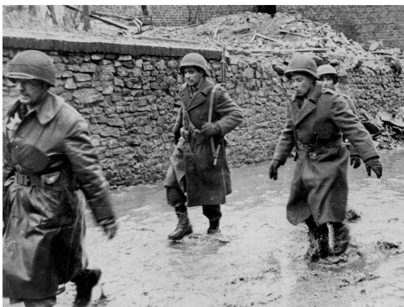
Soldats du 39th Reg/ 9th Infantry Div. sortant de la Forêt de Hürtgen juste avant la Bataille des Ardennes (12/12/1944)

Il a été capturé pendant la bataille et a passé le reste de la guerre en tant que prisonnier de guerre.