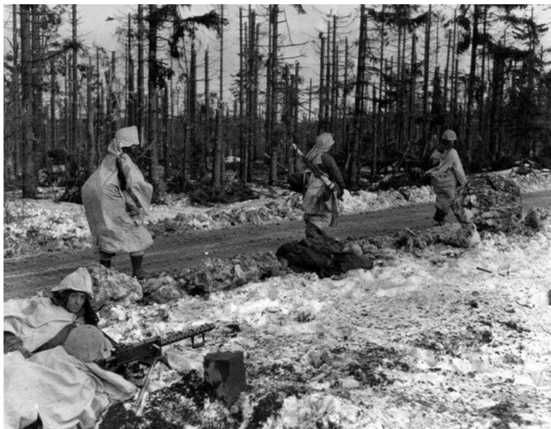
Soldats camouflés pour l'hiver – 9th Infantry Division, à la fin de la Bataille des Ardennes – (ussc)