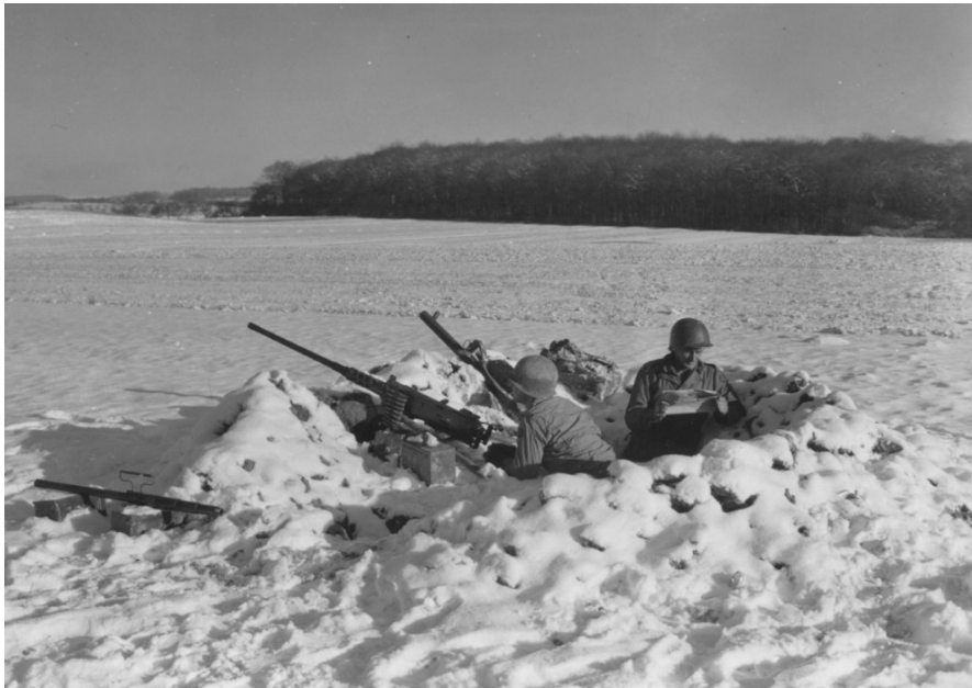
Un nid de mitrailleuses de la 90th Infantry Division à Niedeldorf, en janvier 1945