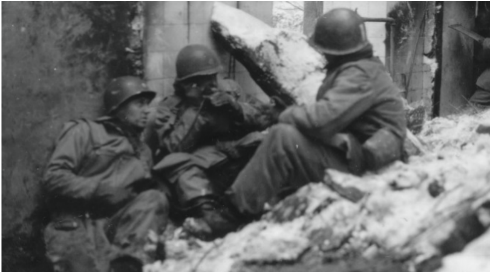
Des hommes de la 90th Infantry Division dans Heckhuscheid, en Allemagne