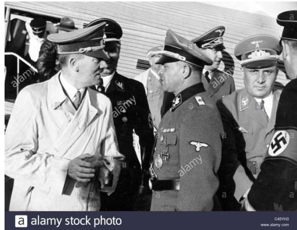
Avec Hitler et Bormann (à dr.)