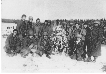
L'artillerie de la 30th en action Noël ne perd pas ses droits